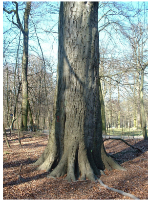
, 14 Mars 2003