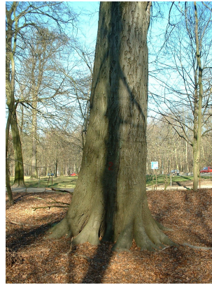
, 14 Mars 2003