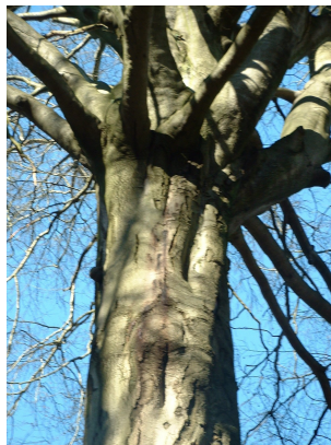
, 14 Mars 2003