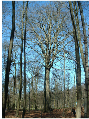
, 14 Mars 2003